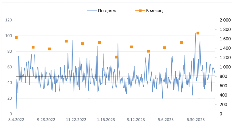
Рис.2. Динамика сообщений о переезде по датам (основная ось, линия) и кумулятивно за каждый месяц (вспомогательная ось, точки), шт.

Средняя вовлеченность (суммарное количество всех реакций в расчете на одно сообщение) составила 182 за весь период, при этом наиболее комментируемыми сообщениями были сообщения аккаунтов с большими количественными атрибутами – размером аудитории. Однако общий внешний инфоповод в них выделить не удалось.