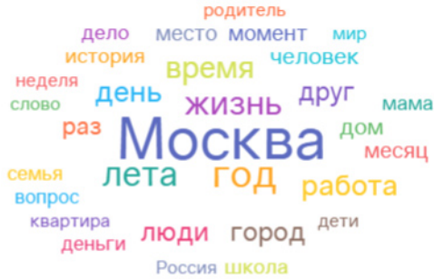
Рис. 3. Облако слов по частоте встречаемости в сообщениях о миграции (величина шрифта пропорциона частоте встречаемости)

дима тренировочная выборка, представляющая собой предварительно размеченную часть анализируемого массива на позитивные и негативные сообщения, что является трудозатратным процессом, либо готовые размеченные наборы данных.