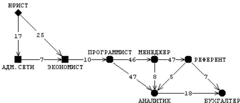
Рис. 3. Визуальное представление данных о предпочтении профессий

престижа профессии при перемещении вершин - вправо и вниз от текущей позиции вершины. Окончательный результат работы алгоритма Кремпеля с новым модельным пространством и новой стратегией перемещения вершин показан на рис. 3.